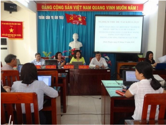
Nghiệm thu đề tài khoa học cấp trường: “Xây dựng bộ câu hỏi trắc nghiệm phần II: Những vấn đề cơ bản về Đảng Cộng sản và lịch sử Đảng Cộng sản Việt Nam”