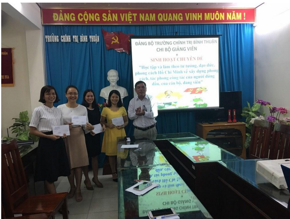
Chi bộ Giảng viên sinh hoạt chuyên đề

Việc thực hành các quy định về nêu gương sẽ góp phần tăng cường kỷ luật, kỷ cương của Đảng; nâng cao năng lực lãnh đạo và sức chiến đấu của tổ chức đảng, đảng viên góp phần ngăn chặn, đẩy lùi sự suy thoái đạo đức, tham nhũng, tiêu cực, củng cố niềm tin của cán bộ, đảng viên và nhân dân ta đối với sự lãnh đạo của Đảng vào sự thắng lợi của sự nghiệp đổi mới đất nước và con đường đi lên chủ nghĩa xã hội ở nước ta./.