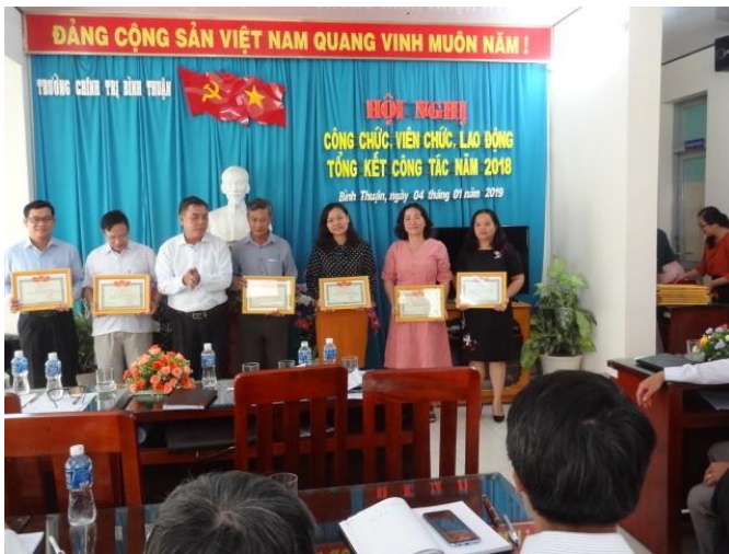
Hội nghị công chức, viên chức, lao động tổng kết công tác năm 2018