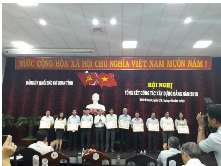
Đảng ủy Trường Chính trị dự Hội nghị Tổng kết công tác Xây dựng Đảng năm 2018