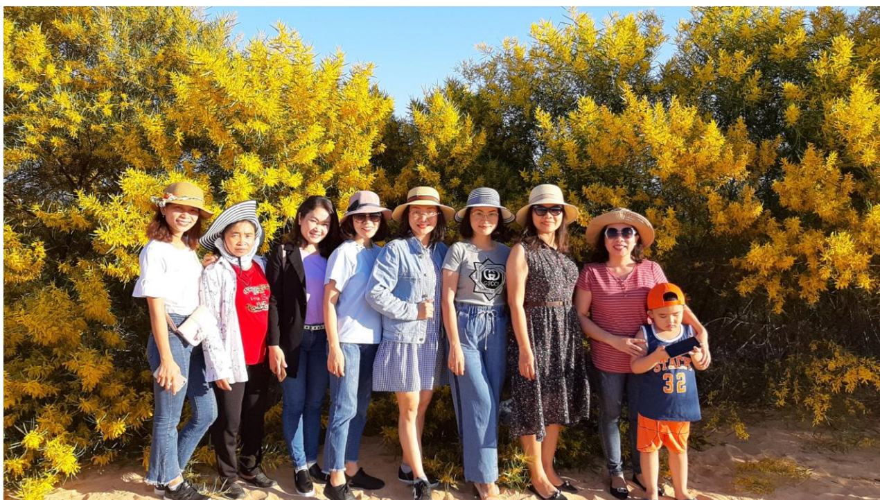
Nữ Công nhà trường sinh hoạt dã ngoại 08/3/2019

Hy vọng trong những năm tới, đội ngũ nữ CCVC-LĐ Trường Chính trị tỉnh Bình Thuận sẽ tiếp tục nỗ lực vươn lên khẳng định vị trí của mình trong thực hiện nhiệm vụ chính trị tại đơn vị, hoàn thành tốt nghĩa vụ công dân nơi cư trú, xây dựng gia đình “no ấm, tiến bộ, bình đẳng, hạnh phúc”/.