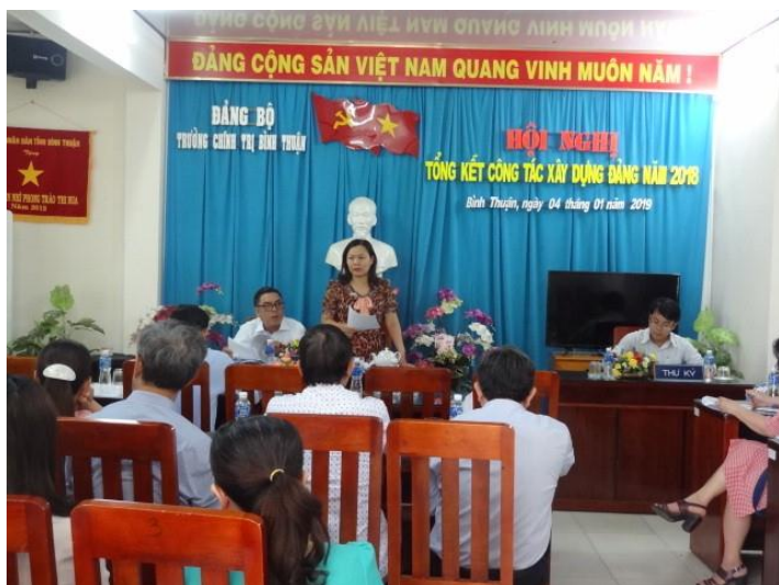
Tổng kết công tác xây dựng Đảng năm 2018