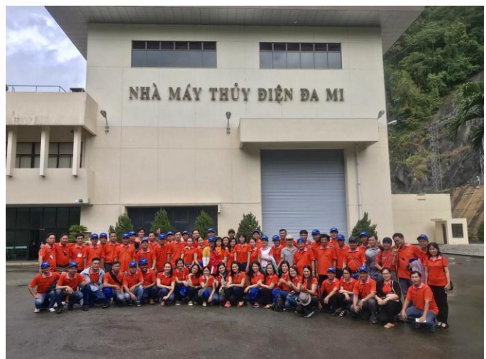
Học viên lớp TCELLCT-HC, hệ tại chức Khóa 87 đi nghiên cứu thực tế