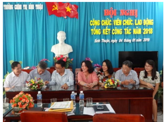
Ký kết giao ước thi đua giữa các phòng khoa Năm 2019