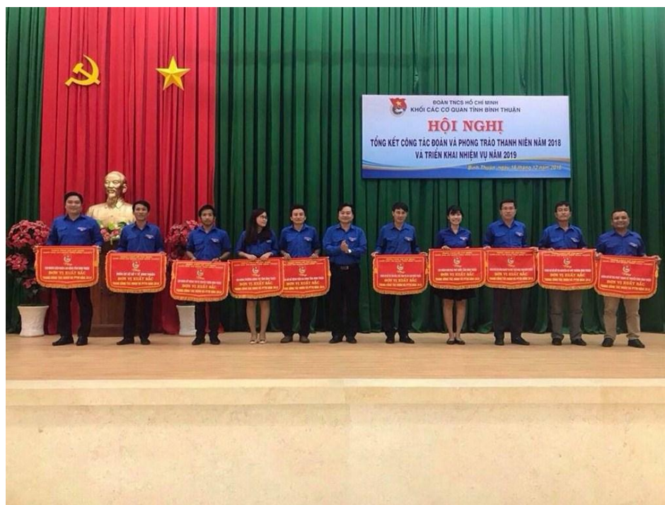
Chi đoàn trường dự Hội nghị tổng kết công tác đoàn và phong trào thanh niên năm 2018

Đảng, Nhà nước và nhân dân ta luôn đặt niềm tin, sự kỳ vọng vào thế hệ trẻ - những người chủ tương lai của nước nhà, lực lượng xung kích trong sự nghiệp công nghiệp hóa, hiện đại hóa đất nước, hội nhập quốc tế, xây dựng và bảo vệ Tổ quốc. /.