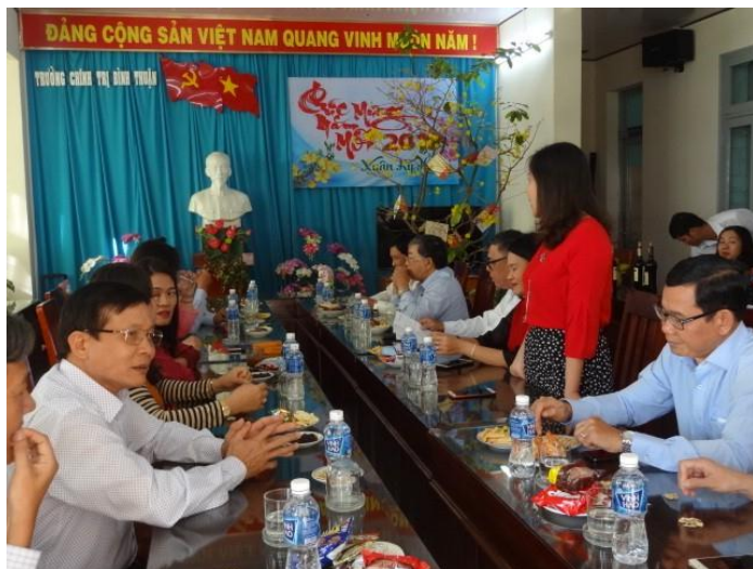
Ban Giám hiệu gặp mặt công chức, viên chức, người lao động nhà trường đầu năm 2019