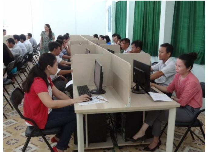
Một buổi thi trắc nghiệm trên máy vi tính của học viên lớp Trung cấp LLCT - HC