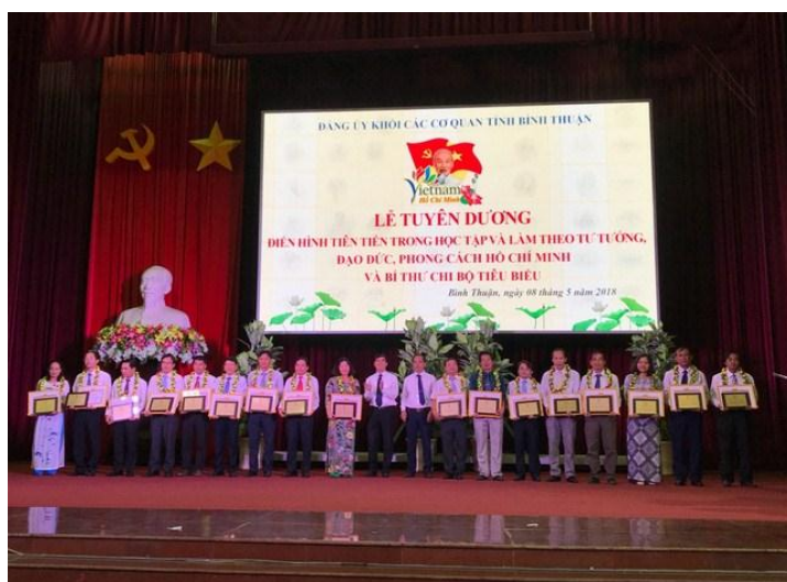
Đảng ủy trường dự Lễ Tuyên dương điển hình tiên tiến Trong học tập và làm theo tư tưởng, đạo đức, phong cách Hồ Chí Minh