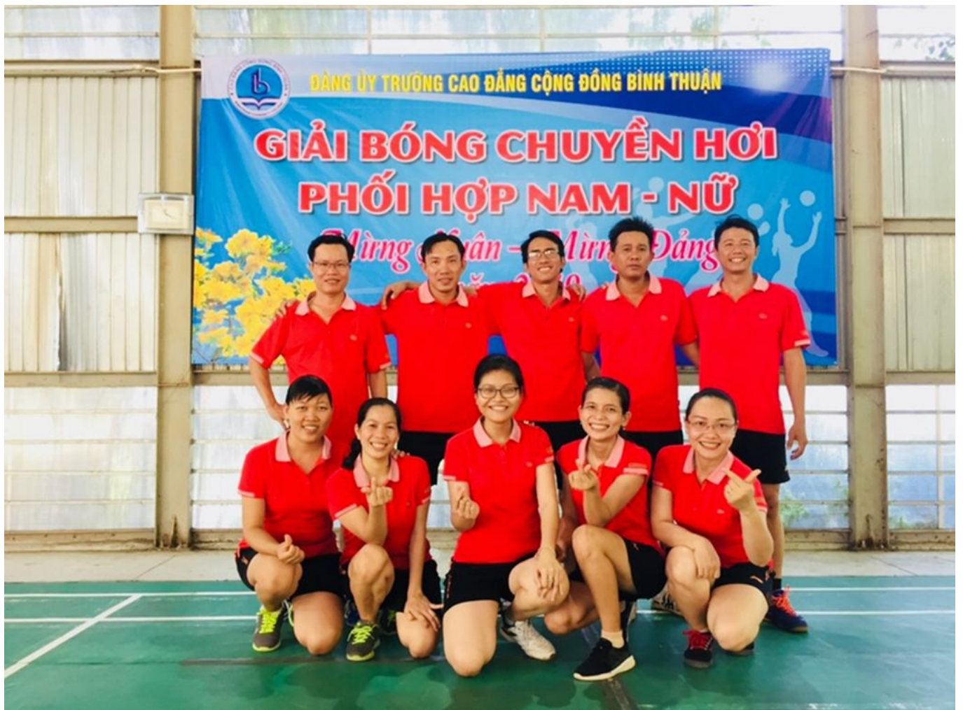
Giao lưu bóng chuyền hơi nam, nữ phối hợp mừng Đảng, mừng xuân 2019