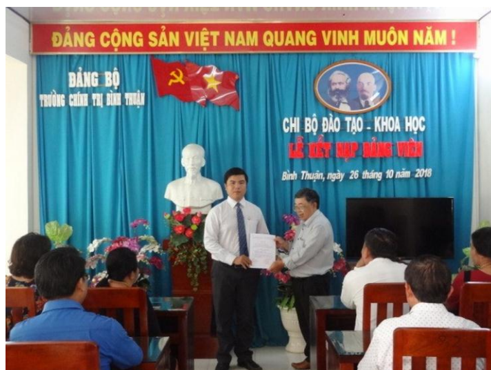
Lễ kết nạp đảng viên năm 2018