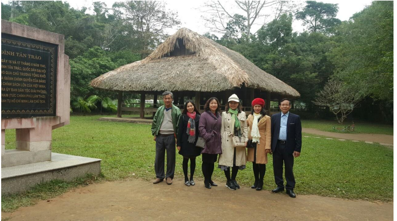
Giảng viên của trường đi nghiên cứu thực tế tại tỉnh Tuyên Quang