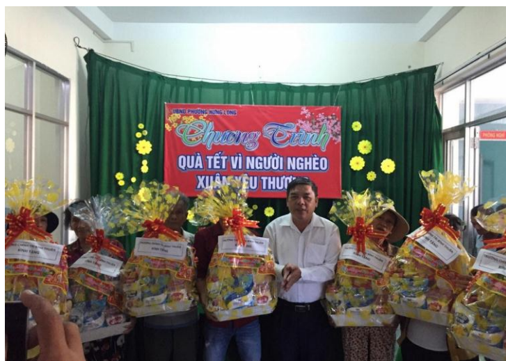
Đảng ủy Trường Chính trị thăm, tặng quà tết Nguyễn Đán năm 2019 cho các hộ nghèo tại xã La Dạ, Hàm Thuận Bắc